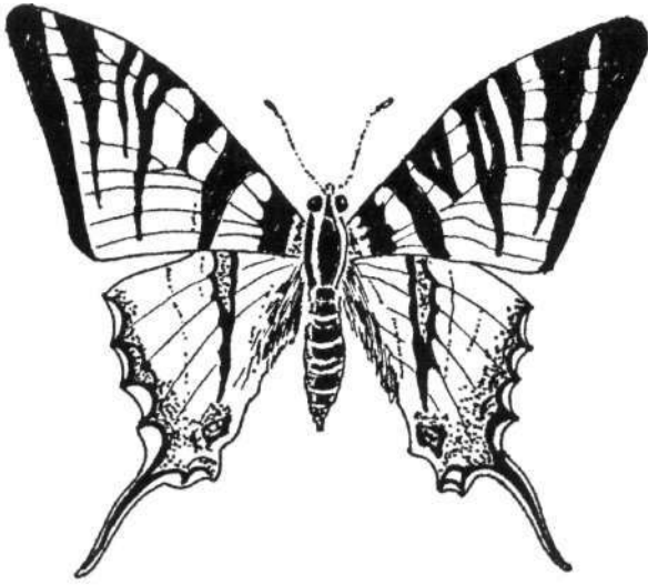
A gazdaságilag közömbös és ma még gyakran mondható kardos lepke a trópusokra beillő szépsége miatt védelmet érdemel Eszmei értéke: 500,- Ft.